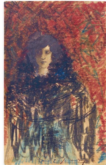
Dibuix, llapis de color i tinta Enric Granados. Museu de la Música