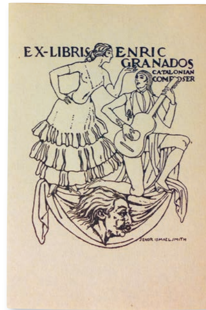
Ex-libris per a Enric Granados Primer quart del segle xx Fundació Palau

Al marge de Goyescas , va destacar en les composicions per a piano, com ara Capricho español o Seis escenas romànticas . També en sobresurten les obres líriques, amb text d'Apel·les Mestres, Picardol , Follet , Gaziel i Liliana , i cançons com Las tonadillas . Dins de la seva producció destaquen les Danzas españolas . Granados pertany a l'època d'esplendor del modernisme, i amb Albéniz, se'l considera el creador de l'escola catalana moderna de piano. A diversos museus de la xarxa es conserven documents gràfics i escrits que mostren l'èxit de la seva carrera i la repercussió de la seva desaparició.