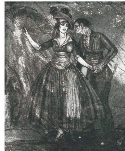
Gravat, 1919. Ismael Smith Museu d'Art de Cerdanyola