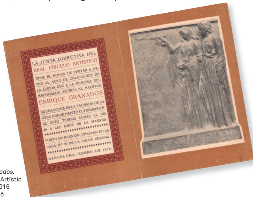
Homenatge a Enric Granados. Reial Cercle Artístic Programa, 1916 Museu Abelló

La figura del compositor lleidatà té una presència destacada a les col·leccions dels museus de la Xarxa de Museus de la Diputació de Barcelona. A partir d'aquests fons es planteja un breu recorregut que aborda la seva figura i l'impacte de la seva mort, la font d'inspiració i la connexió amb Goya i, finalment, el seu cercle d'amistats amb intel·lectuals, artistes i personatges de l'època.